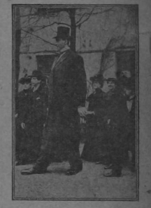
El ruso Macknow, el hombre más alto del mundo, cuya estatura es de 7 metros 11, sus zapatos miden 19 y guantes número 11.