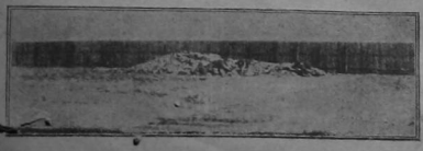
Una montón de cadáveres sobre la nieve en un terreno vallado