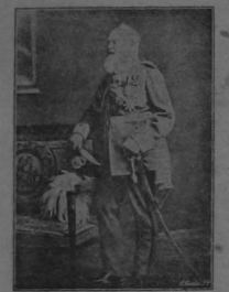
S. A. R. el Príncipe Regente Leopoldo de Bélgica, que cumplirá noventa años el 12 de mayo próximo.