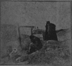
Una ataca del mal, en sus últimos momentos, y custodiada por un soldado