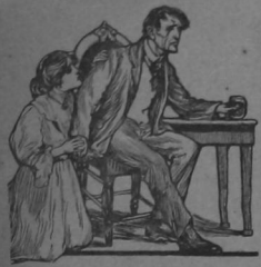
DEPOSITOS: ALAJUELA, ECHISTO, P. FERRER