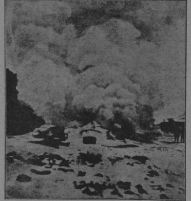
Una hoguera de cremación de cadáveres víctimas de la epidemia.